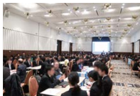
※写真は過去対面形式の様子

京都市内の約38病院が集結! 各病院の話を一度に聞けるチャンス!! 様々な病院の役割や機能を 知り、病院研究を深めよう! 薬剤師の働き方は病院によって 様々! 目指す薬剤師像やなりたい 姿を描いてみよう。