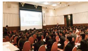
※写真は過去対面形式の様子

※1. 訪問先病院へは、6セッション(回転)のうち2～3回はランダムに振り分けさせていただきます。 ※2. 様々なプログラムを1日通して参加可能な方のみ、ご予約いただけます。