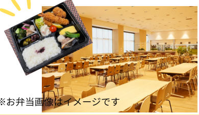
※お弁当画像はイメージです

お弁当を注文いただけます (薬学生無料・要予約) ※注文されない場合は昼食をお持ちください