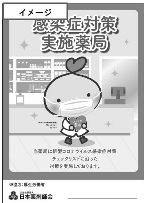
みんなで安心マーク

日本薬剤師会では、新型コロナウイルス感染が拡大している状況下でも、患者さんが安心して薬局に来局できるよう『新型コロナウイルス感染症等感染防止対策実施薬局 みんなで安心マーク』を作成し、感染防止対策を徹底し、チェックリストを満たした薬局に向け、発行できるよう準備を進めています。詳細は9月上旬～中旬にも本会のホームページにて、ご案内する予定です。